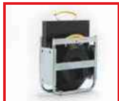
boxy na podložky